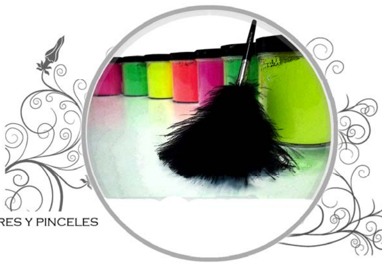
REVELADORES Y PINCELES