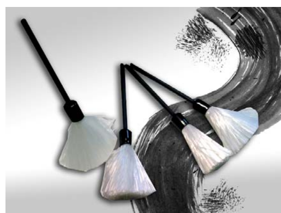
PINCEL DE FIBRA DE VIDRIO