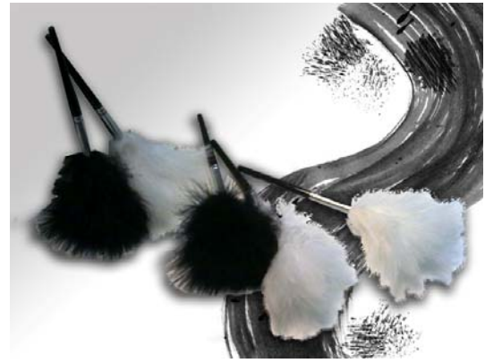
PINCEL DE PLUMA DE MARABÚ