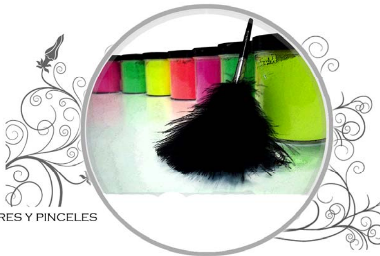
REVELADORES Y PINCELES